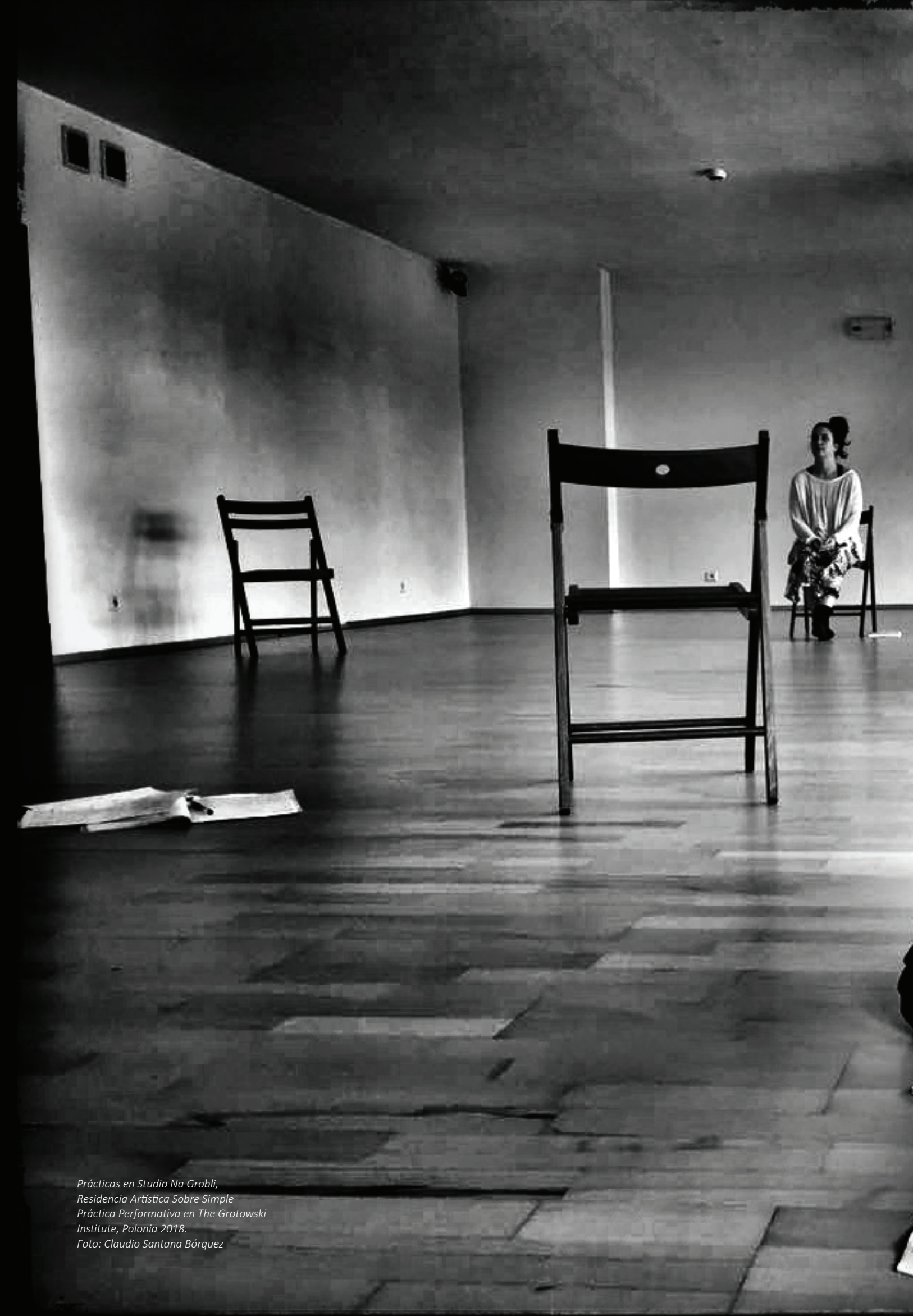
Prácticas en Studio Na Grobli, Residencia Artística Sobre Simple Práctica Performativa en The Grotowski Institute, Polonia 2018.