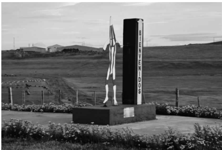
Espíritu de acero en la entrada a Porvenir desde el camino del norte. Febrero de 2016.

Este artículo analiza la dialéctica pasado-presente que se expresa entre la práctica colonial inicial, a fines del siglo XIX, y su conmemoración patrimonial, historiográfica e identitaria. Como plantea Patrick Wolfe, “el colonialismo de asentamiento destruye para reemplazar” 8 . Ese reemplazo o suplantación, como denomina al proceso australiano David Day 9 , se desarrolla a través de negaciones de la diferencia que afirman la legitimidad del despojo. Desde la historia de deportaciones, asesinatos y asimilación forzosa que define a la acumulación primitiva original hasta la historiografía de la omisión, de la asimilación identitaria, y las políticas del patrimonio regional y la definición oficial de símbolos y efemérides, se propone, existen continuidades críticas. De acuerdo con Todorov, el antiguo debate entre Las Casas y Sepúlveda reemplazó, en el siglo XIX, el cristianismo por el humanitarismo. Entonces, quienes buscaban “legitimar la conquista colonial” evitaron expresarse en términos del interés propio, y debieron optar entre dos retóricas. Una apelaba a valores humanitarios reclamando, por lo tanto, que “la meta de la colonización era propagar la civilización, expandir el progreso, y llevar el bien a través del mundo”; la otra reivindicaba “la desigualdad de las razas humanas y el derecho del fuerte a