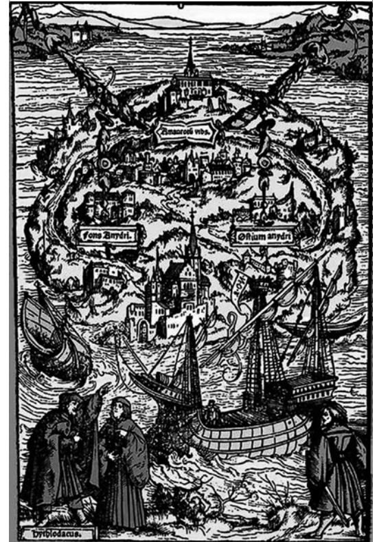
«La Isla Utopía», ilustración de Ambrosii Holbein, Biblioteca Agustana para la edición de 1518.

Con ello se pone de manifiesto la clonación y la formación de no-lugares asociados a ella, se quiebra el aquí y el ahora: el «aura» 6 , lo que implica una pérdida de esencia en la arquitectura al ser copiada una y otra vez sin tener relación con el lugar, las gentes, el clima, etc., de donde se inserta, con lo que se diluye la identidad que implica una pérdida en la posibilidad de dar lugar, pues en vez de producirse una apertura, se produce una