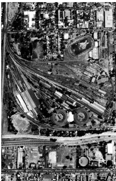
Fotografía aérea Maestranza de San Eugenio.