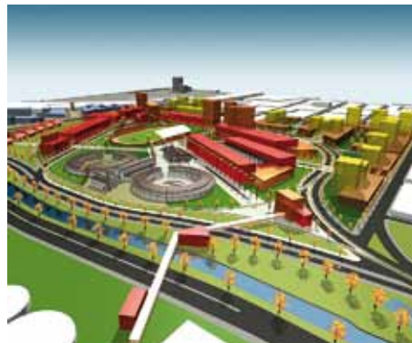
Vista desde el suroriente de la maqueta electrónica del Plan Maestro Maestranza 21.