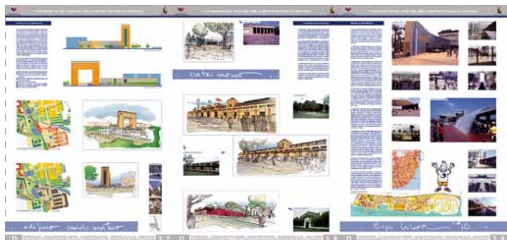
Proyectos Estratégicos para el nudo Av. Carlos Valdovinos - Av. Vicuña Mackenna y Recuperación de Edificios de Valor Patrimonial. Proyecto de Referencia Internacional.