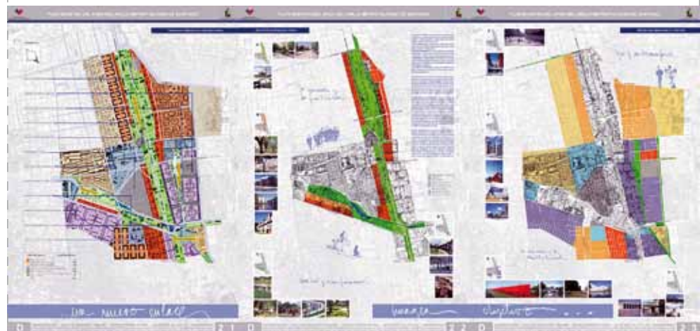
Imagen-Objetivo para el Segmento D: Propuesta urbano arquitectónica e imágenes-objetivos de proyectos estratégicos.