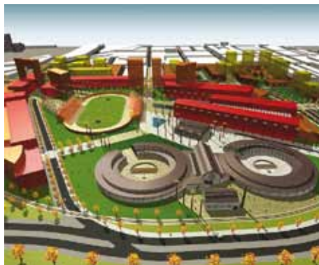
Vista desde el sur de la maqueta electrónica del Plan Maestro Maestranza 21.