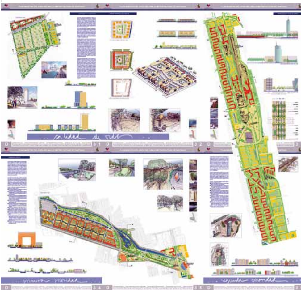
Proyectos Estratégicos de primera y segunda prioridad.