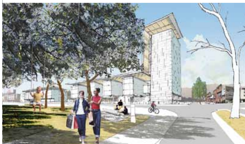
Croquis de propuesta morfológica y de diseño urbano zona del Parque Residencial Soprole.