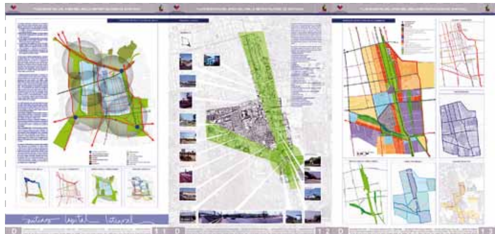
Paneles de marco conceptual general, problemas y propuesta estructural del Segmento D.