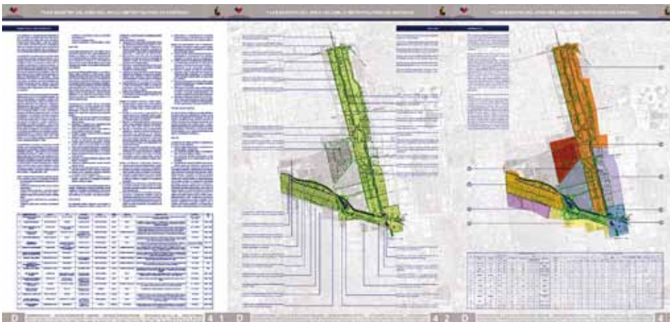
Definición de metas, objetivos y estrategias de la propuesta y anteproyecto del Plan Seccional para el Segmento D.