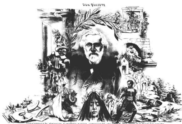
Figura 1: “Justo homenaje de admiración al eminente maestro compositor del arte lírico D o José Verdi”, Don Quijote , XVII/24 (3 de febrero, 1901), pp. 2-3

Por otro lado, consideramos las Memorias de la Intendencia Municipal . La de 1884 contiene información acerca de la hipoteca del Teatro Colón y breves referencias a otros coliseos en relación con la instalación de luz eléctrica. La correspondiente a 1887 tiene un capítulo dedicado a la compra del Teatro Colón; al año siguiente se dio el cierre del Antiguo Teatro Colón que marcó el comienzo del periplo de construcción del actual, inaugurado en 1908. También tiene un informe sobre las ordenanzas y decretos municipales acerca de la seguridad en los teatros. Finalmente, la memoria de 1898 a 1901 es más breve y se detiene solo en el proyecto de construcción del Teatro Colón.