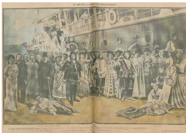
Figura 12: “El mes de la ópera. Las huestes líricas”, La Vida Moderna , 56 (7 de mayo, 1908), pp. 20-21

En la portada aparecía una ilustración satírico-humorística generalmente referente a la política nacional donde encontramos a la ópera como ámbito de referencia para la sátira (cf. Wolkowicz 2020). Como ejemplo mostramos la portada del número 154 de marzo de 1910 en la que se parodia a Salomé para satirizar a Sáenz Peña (ver Figura 13). El trasfondo era el conflicto por la jurisdicción en el Río de la Plata entre Uruguay y Argentina (Rodríguez Ayçaguer 2015) a la vez que una crítica al pacto político trazado en el “Protocolo Ramírez-Sáenz Peña” haciendo uso de la imagen del “baile propiciatorio” que caracterizó a la ópera de Strauss. Esta obra, a su vez, tenía una fuerte carga simbólica en aquel momento porque, como explica Glocer (2019b), dos años antes su estreno argentino fue boicoteado, pero en 1910 volvió a hablarse de su posible puesta en escena hasta su efectiva representación en junio de ese año.