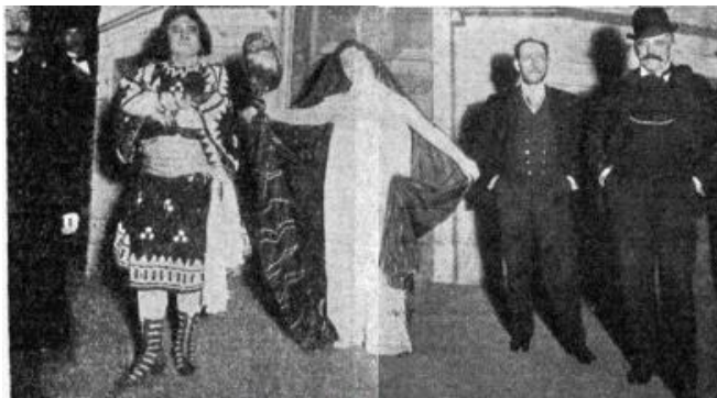
Figura 3: Pacchierotti, Bassi, Carelli, Berutti y Conti. “ Khrisé. La nueva ópera de Berutti ”, Caras y Caretas V/195 (28 de junio, 1902), pp. 23-24

Hacia fines de la década vio la luz Caras y Caretas. Semanario festivo, literario, artístico y de actualidades (1898-1938) 67 , que se convertiría en uno de los semanarios más importantes del país. Su característica saliente fue la imagen, especialmente la fotográfica (Rogers 1997, 2008; Szir 2009b; Cuarterolo 2017). El teatro lírico fue uno de los ámbitos fotografiados; como ejemplo puede considerarse el número 195 (28 de junio, 1902) en el que, además de comentarse los preparativos del estreno de la ópera Khrisé de Arturo Berutti en el Teatro Politeama, se publicaron los retratos del compositor, del libretista Giuseppe Pacchierotti, de los intérpretes Amedeo Bassi y Emma Carelli y del director Arnaldo Conti (ver Figura 3), así como instantáneas de tres momentos de la representación 68 .