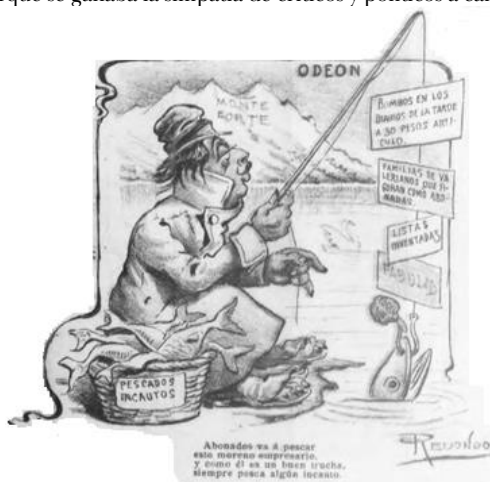
Figura 4: “Odeón”, Don Quijote Moderno , III/28 (12 de julio, 1905), p. 2 75

Un primer grupo es el de las revistas satírico-humorísticas, en las que la ópera figuraba como un ámbito más de interés. Una de ellas fue Cantaclaro. Semanario humorístico, político, social ilustrado (1901), que contenía una columna teatral. En el único número consultado se publicó el retrato de Verdi y una caricatura de Mascagni. Del mismo modo, Guignol. Revista ilustrada, política y parlamentaria (1902-1903) tenía una columna teatral que no dejaba el humor de lado: “En el Politeama, Khryse de Berutti, que no porque sea feo su autor ha dejado de hacer esta vez algo bueno” 72 . La columna se convirtió en suplemento —con numeración propia—: El Forillo. Periódico de teatros 73 . No faltaban las críticas a empresas teatrales, en este caso, la de la Ópera por traer músicos de afuera y porque se ganaba la simpatía de críticos y políticos a cambio de favores 74 .