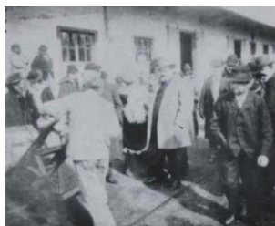
Figura 8: “Enrique Caruso dirigiendo una maniobra”, El Teatro , 6 (16 de mayo, 1901), p. 10