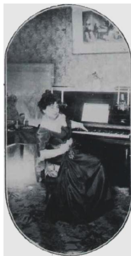
Figura 9: “Madame Darclée íntima”, El Teatro , 9 (13 de junio, 1901), p. 6