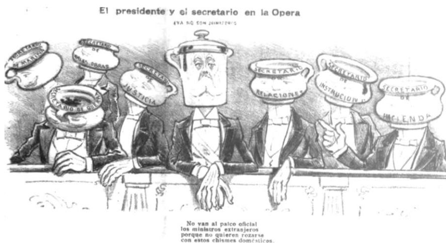
Figura 5: “El presidente y el secretario en la Ópera”, Don Quijote Moderno , III/28 (12 de julio, 1905), p. 2-3