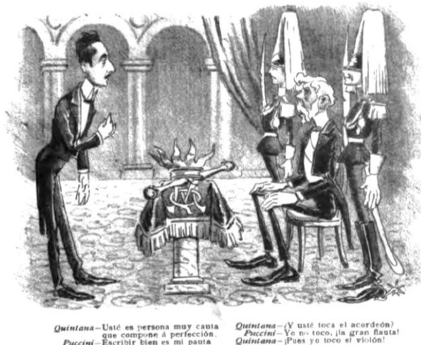
Figura 6: “Visita de Puccini a Quintana”, Don Quijote Moderno , III/26 (28 de junio, 1905), p.